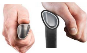
Aro Motor ergonómico Curve L (máxima eficácia na propulsão)