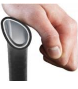
Aro Motor Quadro com revestimento borracha (ideal para tetraplégicos)